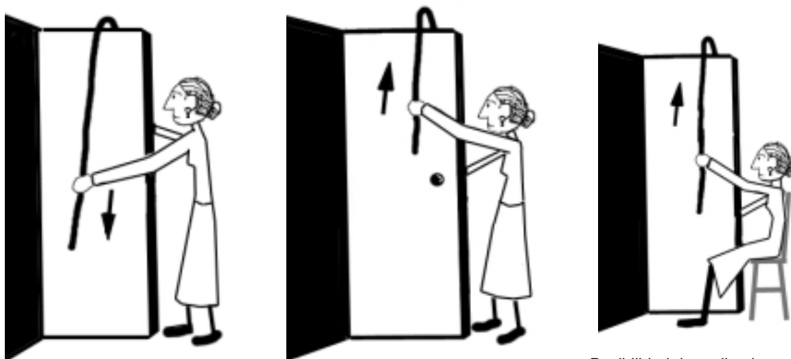
Posibilidad de realizarlo sentado